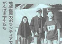
地球復興のボランティアでがんばる学生たち