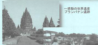
一感動の世界遺産 プランバナン遺跡